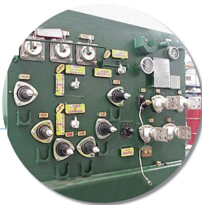
Operación en anillo (6 boquillas en A.T.)