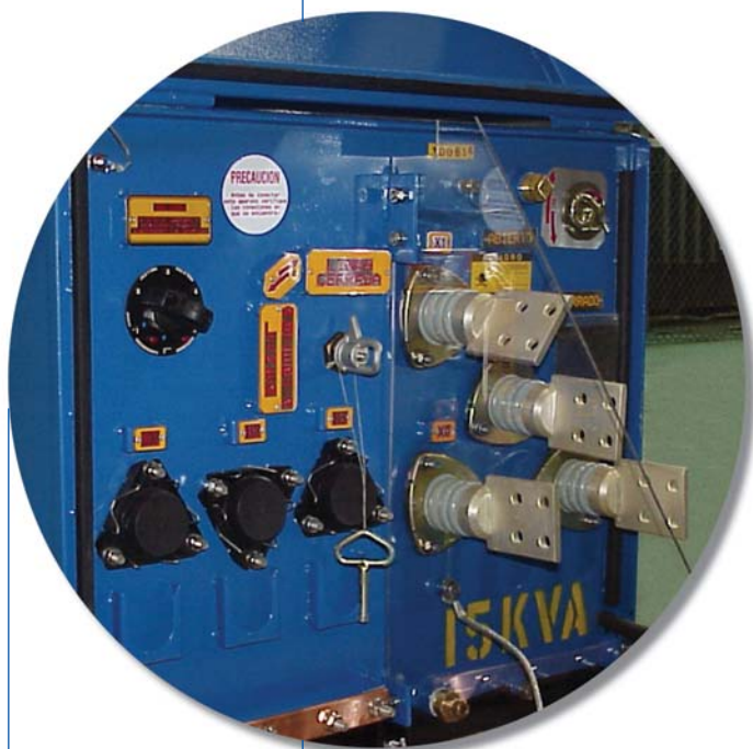
Operación radial (3 boquillas A.T.)